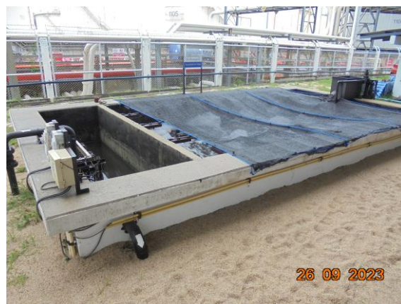
รูปที่ 1.4-1 ระบบบำบัดน้ำเสีย