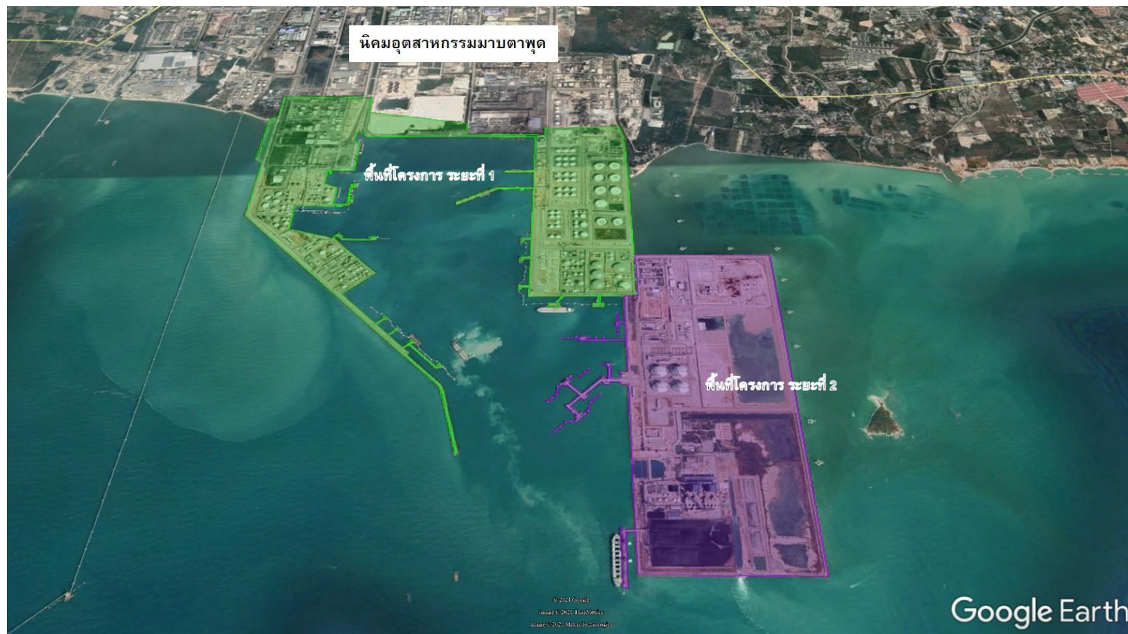
รูปที่ 1.2-1 ที่ตั้งโครงการ